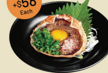
味噌蟹肉甲羅焼 Crabmeat Miso Paste in Shell