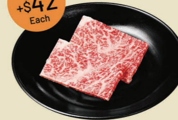
特上日本九州 黑毛和牛肩脊肉 (2片) Japanese Wagyu Chuck Roll (2pcs)