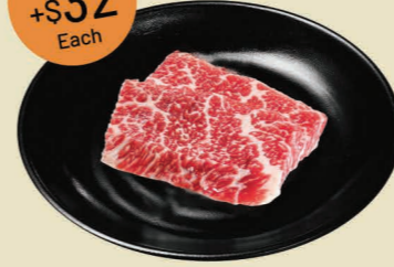
上級牛肋肉 (2片) Premium Karubi (2pcs)