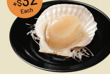
塩味北海道帆立貝 Hokkaido Scallop in Shio Tare