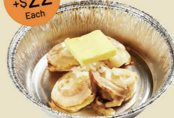
塩味牛油帶子 (4隻) Scallop with Shio Butter (4pcs)