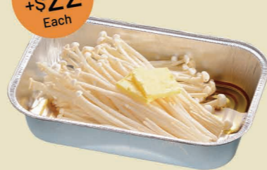
牛油金菇 Enoki Mushroom with Butter