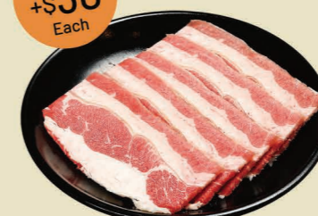
牛五花 (5片) Beef Short Plate (5pcs)