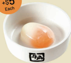
溫泉玉子 Half Boiled Egg