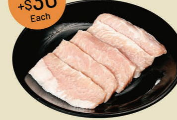
豬頸肉 (5片) Pork Neck (5pcs)