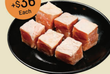
雞腿肉 (6件) Chicken Thigh (6pcs)