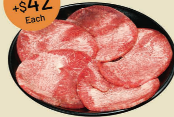
牛舌 (5片) Beef Tongue (5pcs)