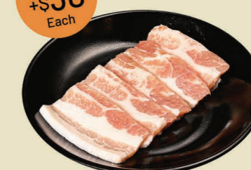
豚肉焼 (5片) Pork Slice (5pcs)