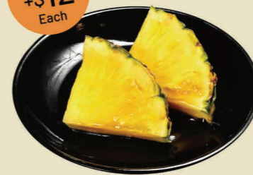
燒菠蘿 (2片) Grilled Pineapple (2pcs)