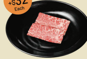
澳洲/美國和牛牛板腱 (2片) AUS / U.S. Wagyu Oyster Blade (2pcs)